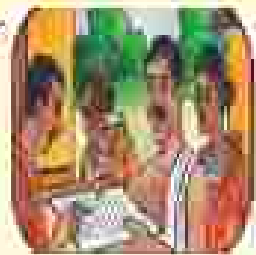
ଆମ ସମାଧାନ କମିଟିର କାର୍ଯ୍ୟକ୍ରମ କାର୍ଯ୍ୟକ୍ରମ କାର୍ଯ୍ୟକ୍ରମ