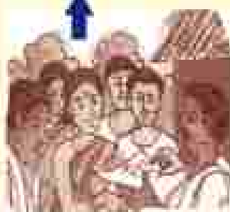
୮) ଉପସକାରୀୟ କମିଟିର ପ୍ରତିକ୍ରିୟା ଉପରେ ଆଧାରିତ ପଦକ୍ଷେପ