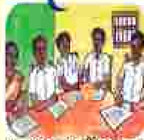
ଆମ ସମାଧାନ କମିଟି କମିଟିର କାର୍ଯ୍ୟକ୍ରମ କାର୍ଯ୍ୟକ୍ରମ