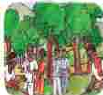
ଆମ ସମାଧାନ କମିଟିର କାର୍ଯ୍ୟକ୍ରମ କାର୍ଯ୍ୟକ୍ରମ କାର୍ଯ୍ୟକ୍ରମ