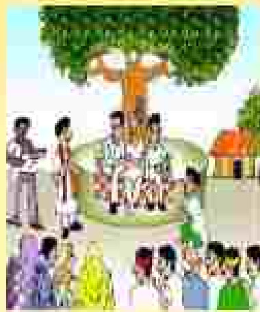
ଆମ ସମାଧାନ କମିଟିର କାର୍ଯ୍ୟକ୍ରମ କାର୍ଯ୍ୟକ୍ରମ କାର୍ଯ୍ୟକ୍ରମ