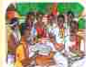
ଆମ ସମାଧାନ କମିଟିର କାର୍ଯ୍ୟକ୍ରମ କାର୍ଯ୍ୟକ୍ରମ କାର୍ଯ୍ୟକ୍ରମ