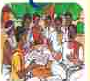
ଆମ ସମାଧାନ କମିଟିର କାର୍ଯ୍ୟକ୍ରମ କାର୍ଯ୍ୟକ୍ରମ କାର୍ଯ୍ୟକ୍ରମ