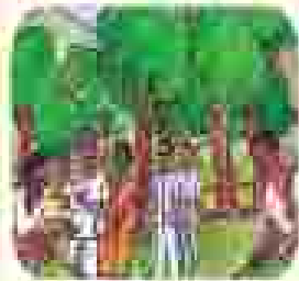
ଆମ ସମାଧାନ କମିଟିର କାର୍ଯ୍ୟକ୍ରମ କାର୍ଯ୍ୟକ୍ରମ କାର୍ଯ୍ୟକ୍ରମ