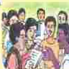
ଆମ ସମାଧାନ କମିଟିର କାର୍ଯ୍ୟକ୍ରମ କାର୍ଯ୍ୟକ୍ରମ କାର୍ଯ୍ୟକ୍ରମ