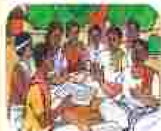
୬) ଉପସକାରୀୟ କମିଟିର ପ୍ରତିକ୍ରିୟା ଉପରେ ଆଧାରିତ ପଦକ୍ଷେପ