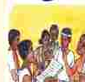
ଆମ ସମାଧାନ କମିଟିର କାର୍ଯ୍ୟକ୍ରମ କାର୍ଯ୍ୟକ୍ରମ କାର୍ଯ୍ୟକ୍ରମ