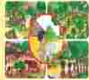
ଆମ ସ୍ୱତନ୍ତ୍ରତା କମିଟି ସମାଧାନ କରୁଥିବା କାଳରେ ଆମ ସ୍ୱତନ୍ତ୍ରତା କମିଟି ସମାଧାନ କରୁଛି