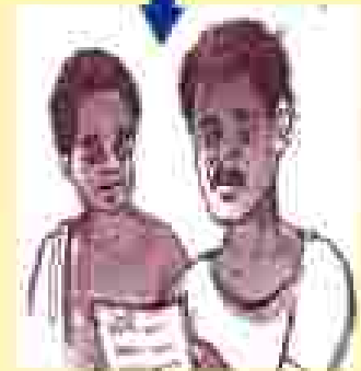
୫) କମିଟିର ପ୍ରତିକ୍ରିୟା