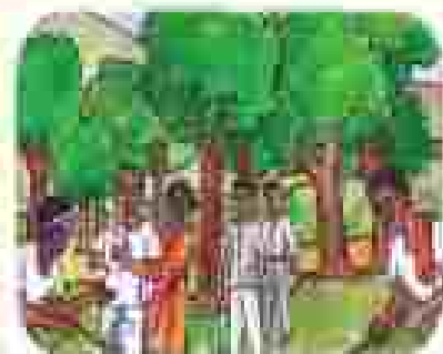
୯) କେବଳେ ଉପସକାରୀୟ କମିଟିର ପ୍ରତିକ୍ରିୟା