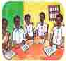
ଆମ ସ୍ୱତନ୍ତ୍ରତା କମିଟି ସ୍ୱୟଂ ଚାଲି ଉଠାଇବା ଏବଂ ସମାଧାନ କରିବା