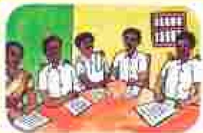
୧) ବିଭାଗୀୟ କମିଟି ଦ୍ୱାରା ନିର୍ଦ୍ଦିଷ୍ଟ ପଦକ୍ଷେପ