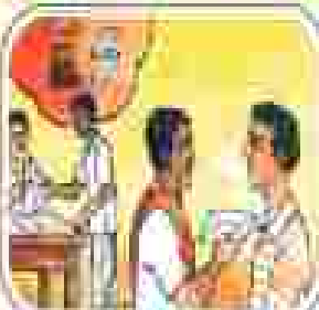
ଆମ ସମାଧାନ କମିଟିର କାର୍ଯ୍ୟକ୍ରମ କାର୍ଯ୍ୟକ୍ରମ କାର୍ଯ୍ୟକ୍ରମ