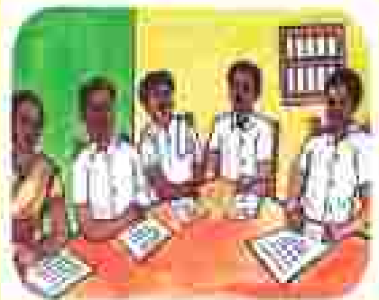
୩) ଉପସକାରୀୟ କମିଟିର ପ୍ରତିକ୍ରିୟା