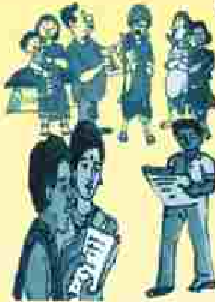
୪) ନିର୍ଦ୍ଦିଷ୍ଟାବଳୀ ଅନୁଯାୟୀ ପଦକ୍ଷେପ