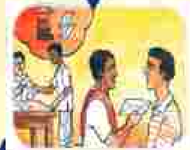
୭) ଉପସକାରୀୟ କମିଟିର ପ୍ରତିକ୍ରିୟା ଉପରେ ଆଧାରିତ ପଦକ୍ଷେପ